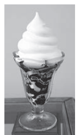
のコー ヒーや 紅茶、 土佐茶

ていたこともあり、地元になしたス タイルのアイスの楽しみ方を提供。 アイスクリームをモチーフにした キャッチーな暖簾をくぐれば、パテ イスリーさながらのショーケースが 目の前に広がる。ライトアップされ たショーケースの中には、色鮮やか な小さな一粒チョコレートのよう な「アイスジェム」を美しくデイス ブレイ。ピスタチオや和三盆、チョコ など80円程度の安価な設定で持ち帰り が可能だ。自家製アイスは、厳選瀬 戸内食材を使用した、香料、保存料、 着色料非添加のフレーバーを使用。 ドライアイスや保冷バッグを利用す れば約1時間ほど保てるため、気軽 な土産として楽しめる。また、店 内奥にはテーブル席と個室があり、 濃厚でクリーミーなソフトクリーム が主役の「コーヒゼリー(780円)」 をはじめとする、約10種類揃うソフ トクリー