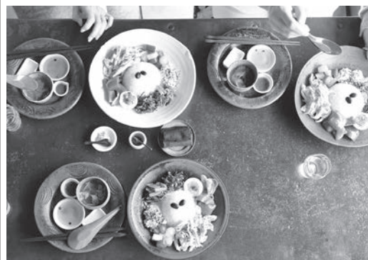
旅の仲間と旅行先のカフェで

お菓子の都、ウィーンの洋菓子店。えめな主張を誇らしいと感じていデメルを開けると、二つ折りのた、当時の私の胸に刺さりました。小さな紙にブランドの物語が記され、洋菓子の伝統も、誰かを想う気持ちです。神聖ローマ帝国を統治したハプスブルク家が御用達とし「栄たとき、届けたいと願う人の心に運誉と伝統をなによりも尊び、華麗でばれていくのです。思い返してみれば、優雅なお菓子づくりを驚嘆すべき厳格さをもって今日まで継承してまいりました。」これは出だしの一部。いっしょにライフスタイルになっていデメルを買うたび、この文面を目で追うだけで浮かんでくる重厚な店内らというものの、言葉と、言葉が映すと、漂う甘い香り。自信に満ち、美しい言葉の数々には心が踊ります。