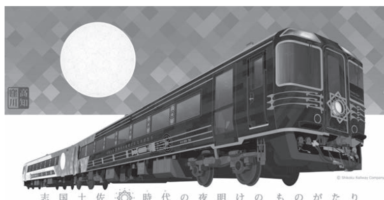
志国土佐時代の夜明けのものがたり

2020年春の運行を予定する、JR四国の新たなものがたり列車「志国土佐時代（トキ）の夜明け」のデザインが発表された。 このたび外観デザインや運賃・料金が決まりました。 デザインコンセプトは「文明開化ロマンティズム」。 車両正面の中央にはロゴマークデザインのヘッドライトをあしらう。